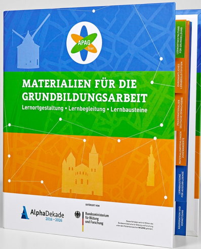
Mockup: Neumann Design, Trier